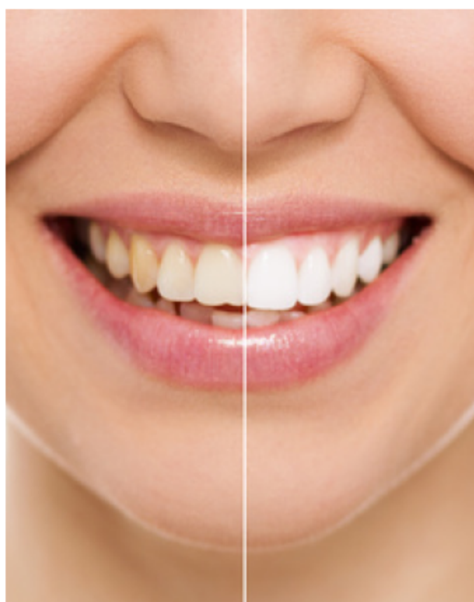
Zahnaufhellung vom Zahnarzt: Gewinnendes Lächeln mit strahlend weißen Zähnen

Professionelle Zahnaufhellung durch den Zahnarzt